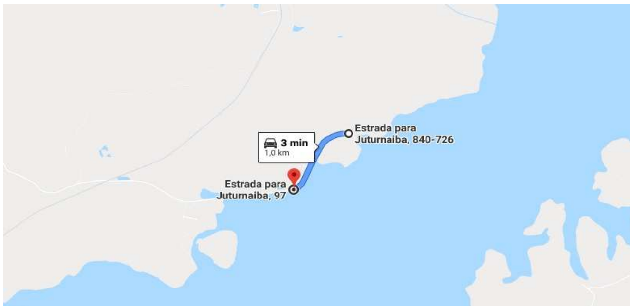
CROQUI TRANSPORTE DE ATERRO EM JAZIDA PRÓXIMA A OBRA