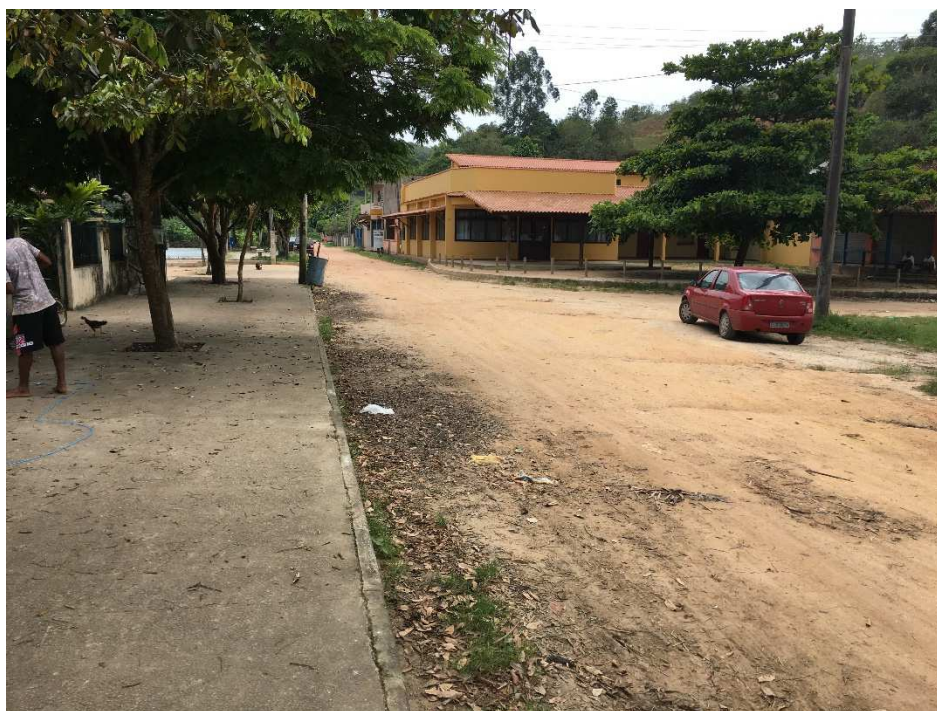
Foto de trecho com calçada executada e meio-fio sem sarjeta

Os únicos meios de se alcançar a região são de carro ou a pé. Não há mais transporte coletivo para o local devido a redução dos royalties no final de 2017. A estrada é feita de barro batido e a paisagem na sua quase totalidade é formada por pastagens. Chegando ao centro do povoado após 13 quilômetros de estrada, encontramos a estação de 'Juturnahyba' às margens da represa de mesmo nome. O trecho em estudo encontra-se após a estação ferroviária e se prolonga por cerca de 210,00m até os restaurantes, quadra poliesportiva e posto de saúde.