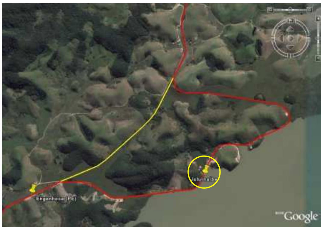
ACIMA: na foto do satélite, a linha em vermelho refere-se ao traçado original e a em amarelo à retificação (Foto Google Maps; composição Cleiton Pieruccini, 2009).

O presente memorial descritivo propõe-se a estabelecer condições de finalização dos serviços de urbanização de trecho da SJA110, parte do bairro de Juturnaíba, correspondendo assim, a primeira etapa de um processo de urbanização da região. O local escolhido para iniciar a urbanização destaca-se pela concentração de equipamentos e comércio e pelo aumento da erosão nas margens da lagoa e adjacências. Este projeto visa à recuperação ambiental das margens da lagoa e da localidade e o tratamento paisagístico favorecendo a qualidade de vida da comunidade, além de promover a acessibilidade e o turismo na região.